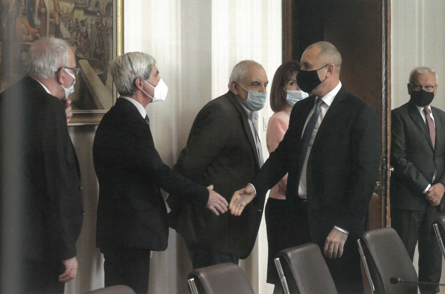
Преди да вземе решението да насрочи парламентарните избори в деня на президентските, Румен Радев се консултира с ЦИК.

наливане на гласове от кандидат към партия, или/и обратно. Разните „патриоти“, които в последните парламенти все не успяват да запишат участие, макар и все още в неясни конфигурации, може да се напънат да излъчат някой по-разпознаваем образ (въпреки дълбоката криза, в която изглеждат). Едва ли „всестранно развитият“ лидер на „Възраждане“ Костадин Костадинов ще пропусне възможността да се пробва и да упражни антимигрантска и антиваксерска реторика. Винаги може да се слага в сметките и някоя нова изненада звезда ала Радев, който изгря на изборите през 2016 г.