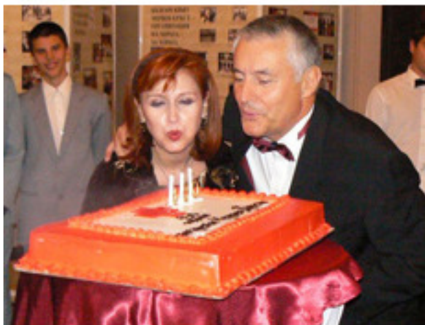
Председателят на БЧК Христо Григоров и генералният директор д-р София Стоименова на 130 годишнината на БЧК

Председателят представлява Българския Червен кръст. Той осъществява контрол за изпълнение на решенията на Общото събрание и Националния съвет, осъществява общ контрол на администрацията на Българския Червен кръст. В момента председател на Българския Червен кръст е Христо Григоров